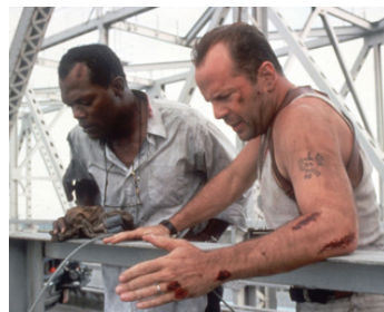
1995 UNE JOURNÉE EN ENFER (Die Hard with a Vengeance) de John McTiernan avec Bruce Willis