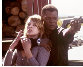
2002 SANS MOTIF APPARENT (No good deed) de Bob Rafelson avec Milla Jovovich