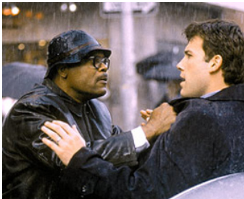
2002 DÉRAPAGES INCONTRÔLÉS (Changing Lanes) de Roger Michell avec Ben Affleck