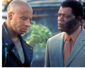
2002 xXx (xXx) de Rob Cohen avec Van Diesel