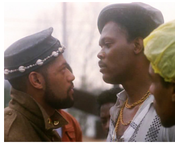
1988 SCHOOL DAZE (School Daze) de Spike Lee avec Laurence Fishburne