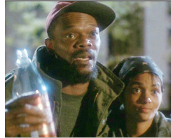
1991 JUNGLE FEVER (Jungle Fever) de Spike Lee avec Halle Berry