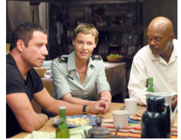
2003 BASIC (Basic) de John McTiernan avec John Travolta, Connie Nielsen