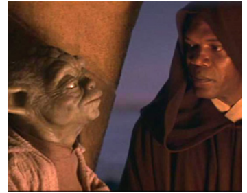
1999 STAR WARS, LA MENACE FANTÔME (The Phantom Menace) de George Lucas avec Yoda