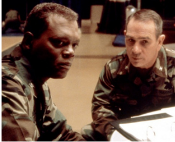
2000 L'ENFER DU DEVOIR (Rules of Engagement) de William Friedkin avec Tommy Lee Jones