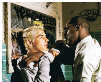
1997 187 CODE MEURTRE (One Eight Seven) de Kevin Reynolds avec Jonah Rooney