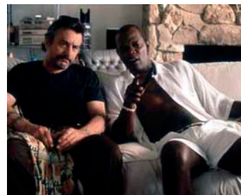
1997 JACKIE BROWN (Jackie Brown) de Quentin Tarantino avec Robert De Niro