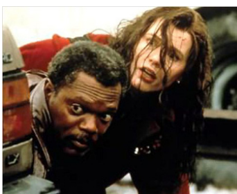
1996 AU-REVOIR À JAMAIS (The Long Kiss Goodnight) de Renny Harlin avec Geena Davis