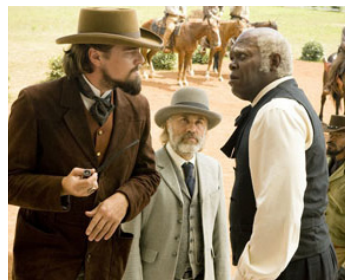
2012 DJANGO UNCHAINED de Quentin Tarantino avec Leonardo Di Caprio, Christopher Waltz