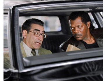
2005 LE BOSS (The Man) de Les Mayfield avec Eugene Levy