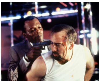
1995 KISS OF DEATH (Kiss of Death) de Barbet Schroeder avec Nicolas Cage