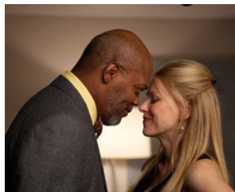
2010 MOTHER AND CHILD (Mother and Child) de Rodrigo Garcia avec Naomi Watts