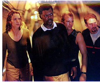
1999 PEUR BLEUE (Deep blue Sea) de Renny Harlin avec Saffron Burrows, Th. Jane, M. Rappaport