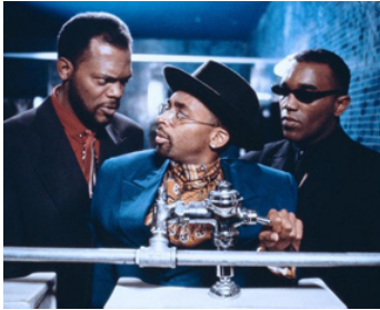
1990 MO BETTER'S BLUES (Mo' Better's Blues) de Spike Lee avec Spike Lee, Joie Lee