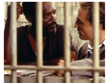
1996 LE DROIT DE TUER ? (A Time to Kill) de Joel Schumacher avec M. McCaughy