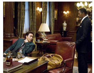
2007 CHAMBRE 1408 (1408) de Mikael Häfström avec John Cusack