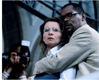
2004 IN MY COUNTRY (In my Country) de John Boorman avec Juliette Binoche