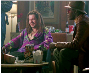
1993 TRUE ROMANCE (True Romance) de Tony Scott avec Gary Oldman