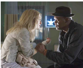
2006 LA COULEUR DU CRIME (Freedomland) de Joe Roth avec Julianne Moore