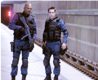
2003 S.W.A.T. UNITÉ D'ÉLITE (S.W.A.T.) de Clark Johnson avec Colin Farrell