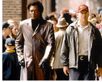
2000 INCASSABLE (Unbreakable) de M.Night Shyamalan avec Bruce Willis