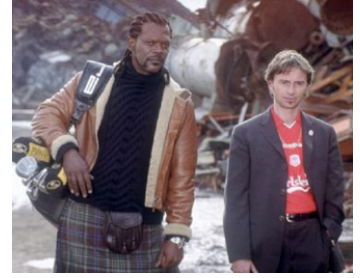
2001 LE 51 E ÉTAT (The 51st State) de Ronny Yu avec Robert Carlyle