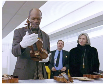
1998 LE VIOLON ROUGE (The Red Violin) de François Girard avec Monique Mercure