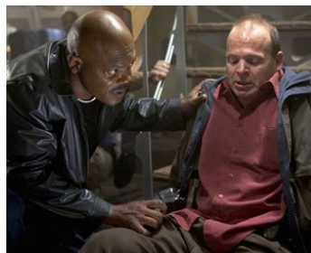
2006 DES SERPENTS DANS L'AVION (Snakes on a Plane) de David R. Ellis avec Mark Houghton