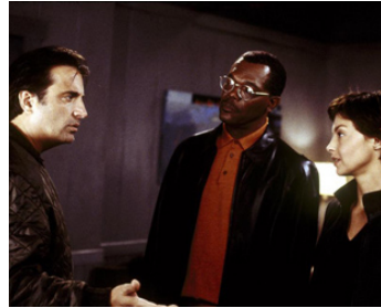
2004 INSTINCTS MEURTRIERS (Twisted) de Philip Kaufman avec Andy Garcia, Ashley Judd