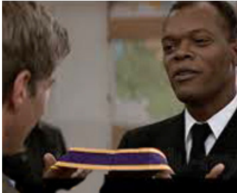
1992 JEUX DE GUERRE (Patriot Games) de Phillip Noyce avec Harrison Ford