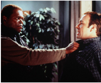
1998 NÉGOCIATEUR (The Negotiator) de F. Gary Gray avec Kevin Spacey