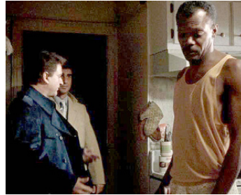
1990 LES AFFRANCHIS (Goodfellas) de Martin Scorsese avec Joe Pesci