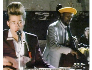
1991 JOHNNY SUEDE (Johnny Suede) de Tom Di Cillo avec Brad Pitt