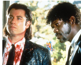
1994 PULP FICTION (Pulp Fiction) de Quentin Tarantino avec John Travolta