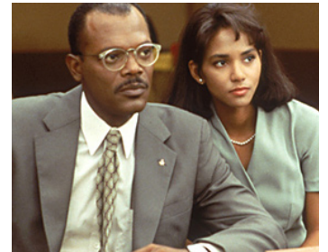
1995 LOSING ISAIAH, LES CHEMINS DE L'AMOUR (Losing Isaiah) de S. Gyllenhaal avec Halle Berry