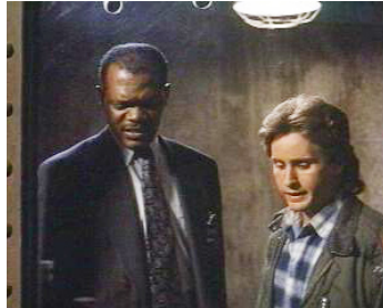
1993 ALARME FATALE (Loaded Weapon) de Gene Quintano avec Emilio Estevez