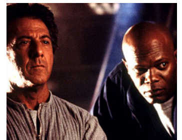
1998 SPHÈRE (Sphere) de Barry Levinson avec Dustin Hoffman