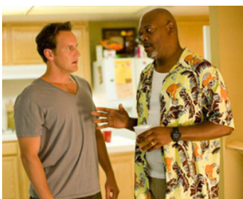
2008 HARCELÉS (Lakeview Terrace) de Neil LaBute avec Patrick Wilson