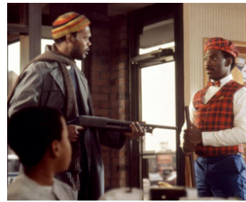
1988 UN PRINCE À NEW YORK (Coming to America) de John Landis avec Eddie Murphy