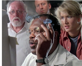
1993 JURASSIC PARK (Jurassic Park) de Steven Spielberg avec R. Attenborough, Laura Dern