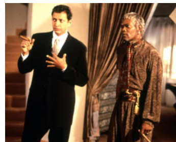
1996 LA COULEUR DE L'ARNAQUE (The Great White Hype) de Reginald Hudlin avec Jeff Goldblum