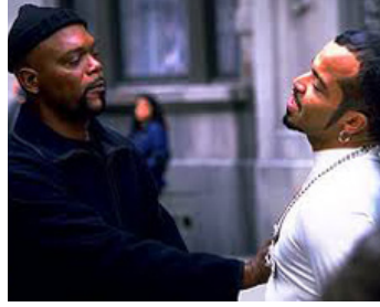
2000 SHAFT (Shaft) de John Singleton avec Jeffrey Wright